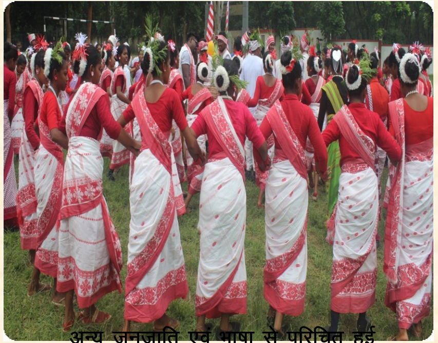
अन्य जनजाति एवं भाषा से परिचित हुई

मैं आदिवासी मुण्डा दल की ओर से मुण्डा गाने में डांस की। मुझे मुण्डा भाषा थोड़ा बहुत पता है। फिर भी सभी मिलकर बहुत ही अच्छी तरह से गाना गाये और नाचे भी। पता ही नहीं चला कि समय कैसे बीत गया। लग रहा था कि और कुछ समय मिलता तो और अच्छा लगता।