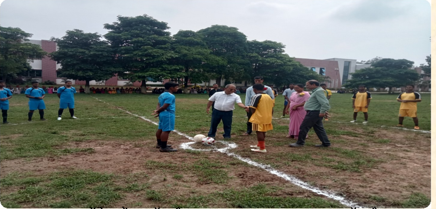
कॉलेज में फुटबॉल मैच