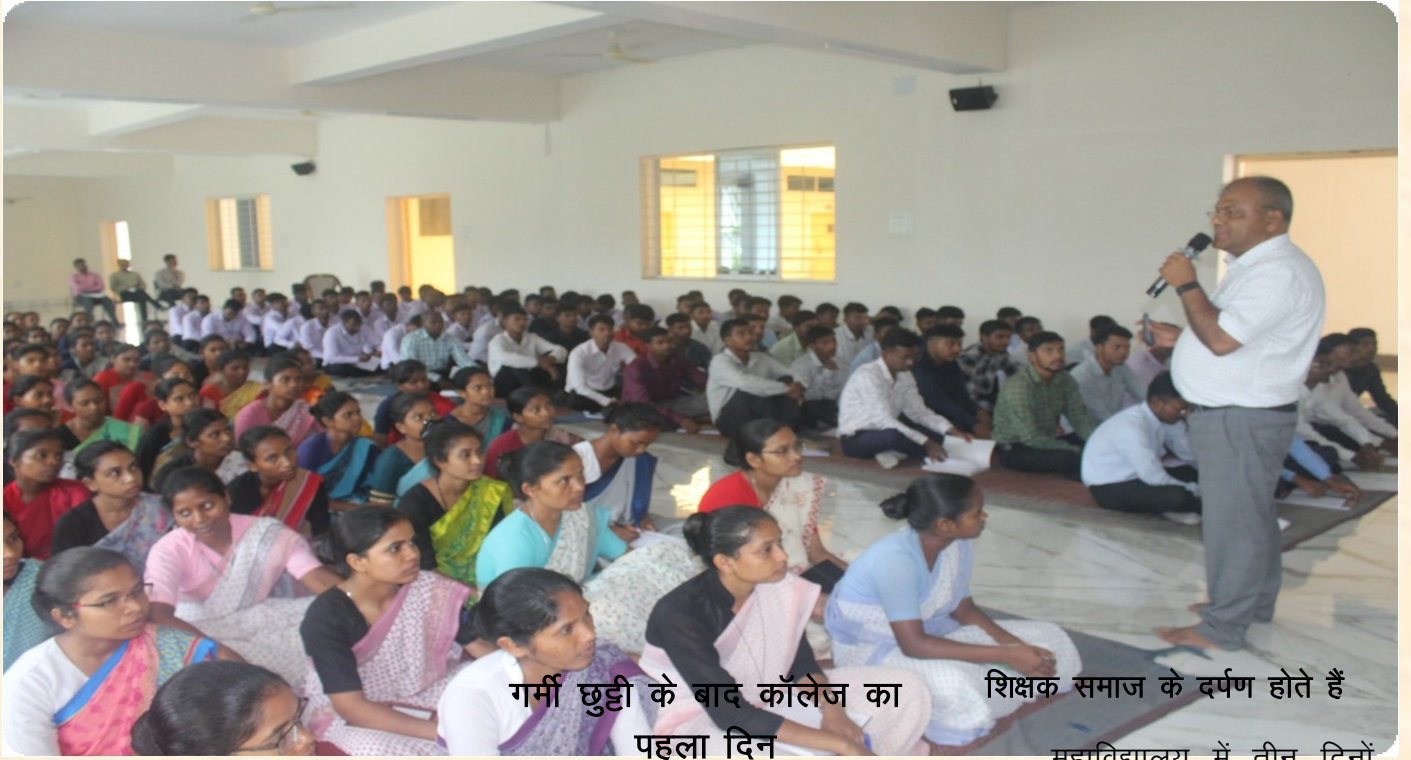
गर्मी छुट्टी के बाद कॉलेज का पहला दिन शिक्षक समाज के दर्पण होते हैं